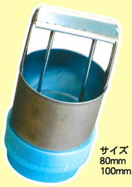
サイズ 80mm 100mm