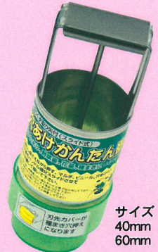
サイズ 40mm 60mm