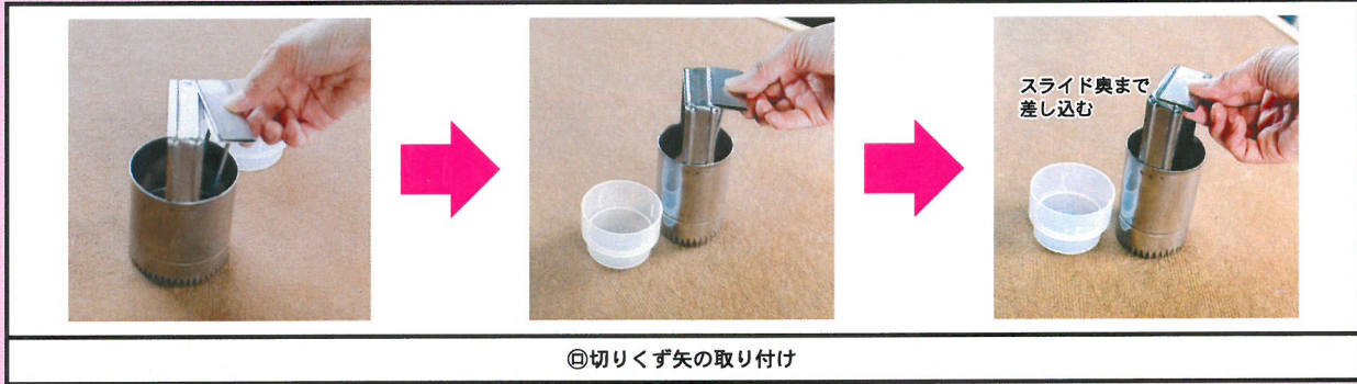
②切りくず矢の取り付け