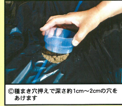
⑥種まき穴押えで深さ約1cm~2cmの穴をあけます