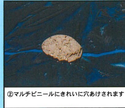
②マルチビニールにきれいに穴あけされます