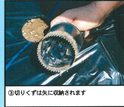
③切りくずは矢に収納されます