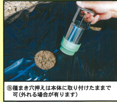
⑤種まき穴押えは本体に取り付けたままで可(外れる場合があります)