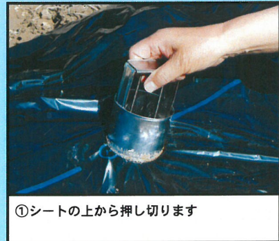
①シートの上から押し切ります