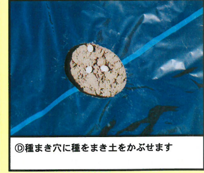
⑦種まき穴に種をまき土をかぶせます